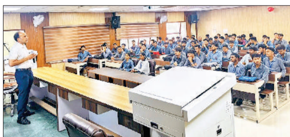
नारनौल। विद्यार्थियों को विशेष व्याख्यान देते हुए लेक्चरर।