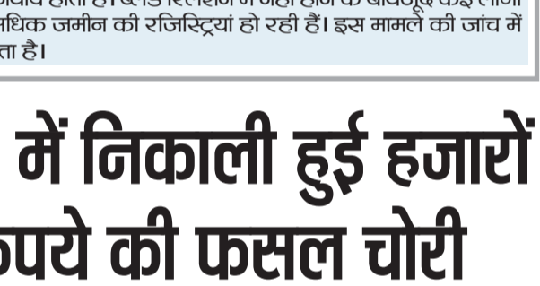
रेवाड़ी। किसान के खेत में चोरी की जांच करते हुए कसोला पुलिस।