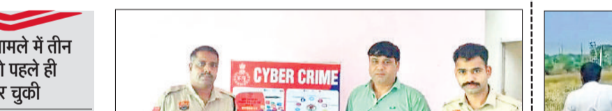
रेवाड़ी। साइबर ठगी का आरोपी पुलिस टीम के साथ।

पुलिस इस मामले में तीन आरोपियों को पहले ही गिरफ्तार कर चुकी