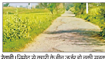
रेवाड़ी। निमोट से कपूरी के बीच जर्जर हो चुकी सड़क।