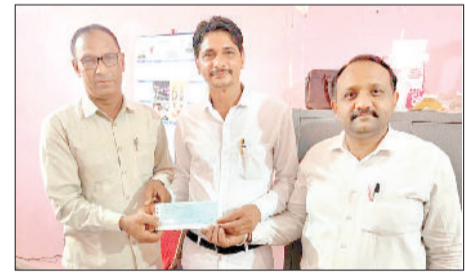
कनीना। अटेली विधायक एवं प्रदेश की स्वास्थ्य मंत्री आरती सिंह राव की ओर से बार एसोसिएशन को 10 लाख रुपये की प्रोत्साहन राशि प्रदान करने पर अधिवक्ताओं ने खुशी जताई है।