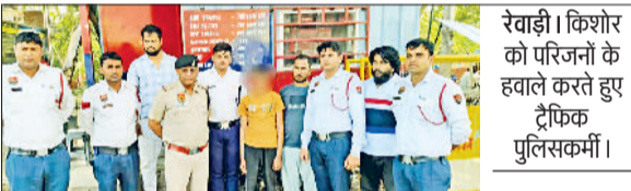
रेवाड़ी। किशोर को परिजनों के हवाले करते हुए ट्रैफिक पुलिसकर्मी।

दिल्ली के द्वारका से गत 15 मार्च को अचानक घर से लापता हुए किशोर के परिजन उसकी तलाश में दर-दर भटक रहे थे। वह बच्चा सिटी ट्रैफिक पुलिस को मिला, तो उसे सकुशल परिजनों के हवाले कर दिया गया। इससे परिजनों के चेहरे पर मुस्कान लौट आई। बच्चा सकुशल मिलने पर परिजनों ने जिला पुलिस का आभार व्यक्त किया। सिटी ट्रैफिक पुलिस ने बीएमजी मॉल के पास लगभग 16