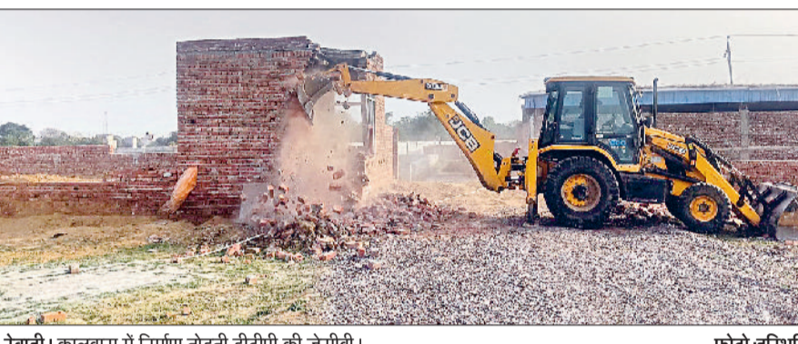
रेवाड़ी। कालूवास में निर्माण तोड़ती डीटीपी की जेसीबी।

अनुमति निर्माण करने वाले लोगों के खिलाफ तौड़फोड़ की कार्रवाई लगातार की जा रही है। सप्ताह में दो से तीन बार डीटीपी की जेसीबी मशीन अवैध निर्माण तोड़ने के लिए मैदान में उतरती है। इस समय अवैध निर्माण को लेकर आरोप-प्रत्यारोप का मामला भी पूरी तरह से गर्माया हुआ है। एक कांग्रेसी नेता की ओर से हाल ही में सत्ता पक्ष से जुड़े लोगों पर कॉलोनियां काटने और अवैध निर्माण कराने के आरोप लगाए थे। मंगलवार को डीटीपी की ओर से कालूवास में तौड़फोड़ की संभावित कार्रवाई को उस समय झटका लगा, जब परीक्षाओं में व्यस्त होने की बात कहते हुए एसपी ने पुलिस बल मुहैया कराने से मना कर दिया। डीटीपी ने पुलिस फोर्स नहीं मिलने की शिकायत सीधे सरकार से करने का निर्णय लिया है। शहर के बाहरी इलाकों में इस समय बिना अनुमति प्लॉटिंग और निर्माण का खेल चल रहा है। प्रभावशाली लोग इस कार्य को खुलकर अंजाम देने में लगे हुए हैं। डीटीपी की ओर से भी बिना