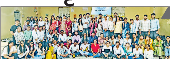
रेवाड़ी। कैप के समापन अवसर पर मौजूद स्वयंसेवक व अतिथिगण।

केएलपी कॉलेज की ओर से बीकानेर में लगाए गए एनएसएस शिविर के सातवें दिन की शुरुआत शिविर स्थल की सफाई एवं सजावट से हुई। इसके साथ ही स्वयंसेवकों द्वारा आकर्षक एनएसएस लोगो की रंगोली बनाई गई। समापन समारोह में आए अतिथियों का स्वागत तिलक एवं