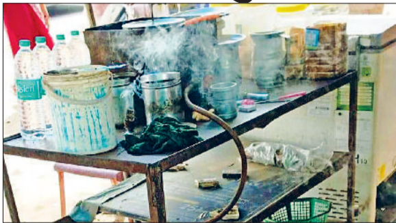
रेवाड़ी। रेहड़ियों पर प्लास्टिक बैग में घुसाकर रखे हुए घरेलू गैस सिलेंडर।

अमेरिका-इजराइल व ईरान युद्ध के चलते गैस संकट की आशंका से लोगों में दस दिनों से सिलेंडर लेने के लिए मारामारी बनी हुई थी। पुलिस सुरक्षा के बीच सिलेंडरों का वितरण हो रहा था। इस दौरान कई एजेंसियों पर ग्राहकों ने हंगामा भी किया था। घरेलू गैस सिलेंडरों की आपूर्ति ज्यादा प्रभावित नहीं हुई थी, परंतु 'पैनिक' के चलते