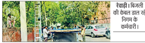
रेवाड़ी। बिजली की केबल डाल रहे निगम के कर्मचारी।

बिजली निगम की ओर से लाइनों की मॉन्टिंग और केबल बिछाने का कार्य तेजी से कराया जा रहा है। इसी कार्य के चलते जगह-जगह बीएसएनएल की केबलें कट रही हैं, जिससे फोन डेड होने के साथ ही इंटरनेट सेवा भी प्रभावित हो रही है। बीएसएनएल कर्मियों को लाइनों को दुरुस्त करने में जमकर परेशान बाहाना पड़ रहा है। इसी कड़ी में मंगलवार को डीसी